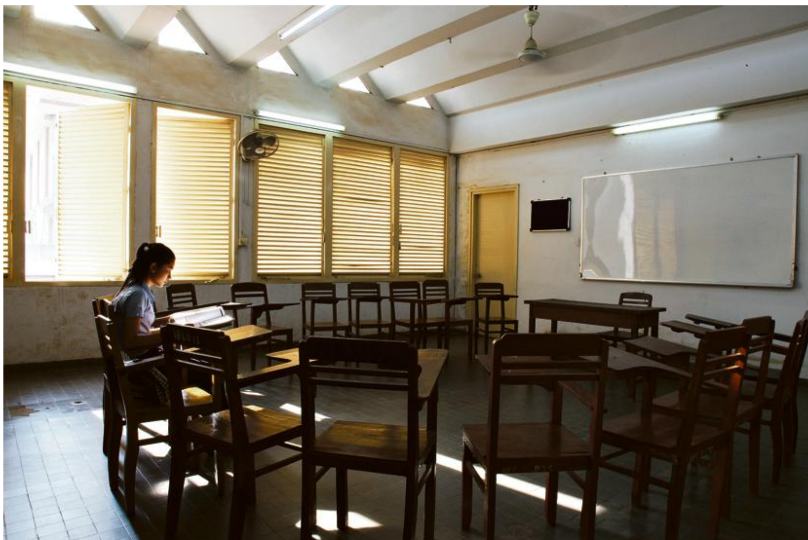
Sotheary, née en 1989, étudiante en français, pose dans une salle de l'Institut des langues étrangères construit en 1972 par Vann Molyvann.