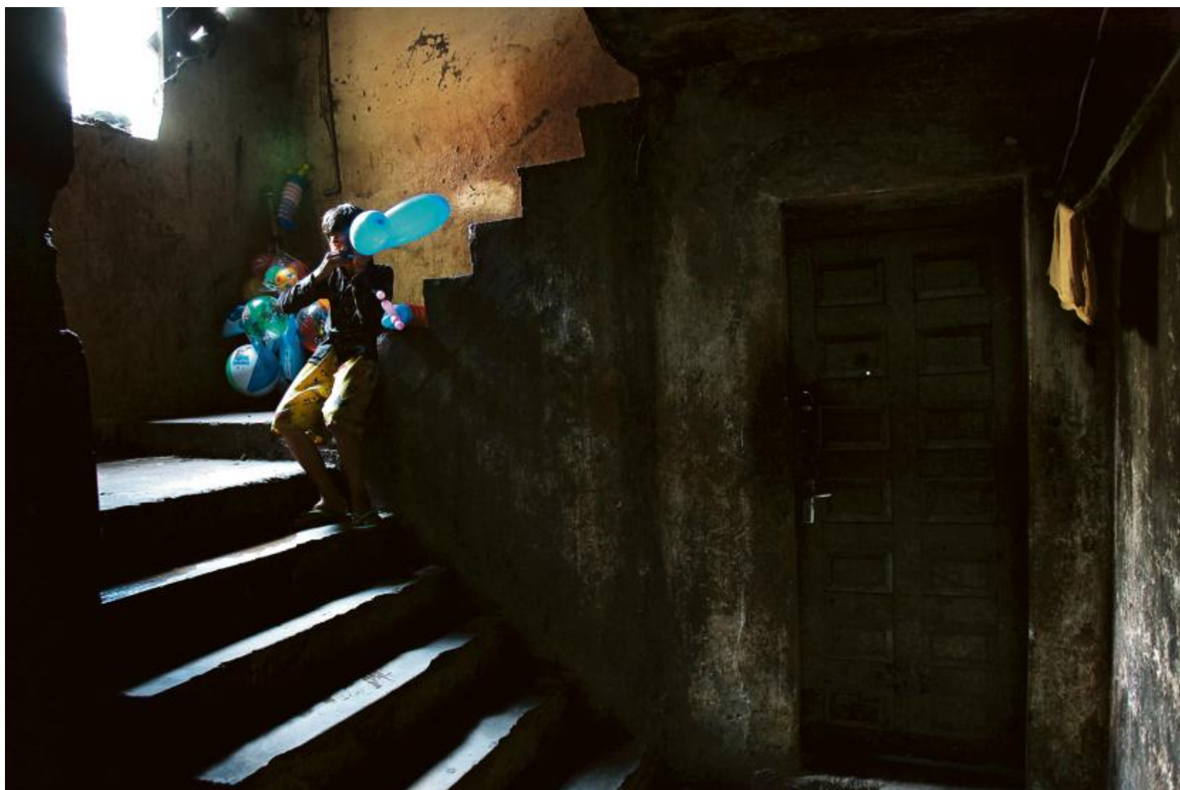
Bunrong, né en 1998, dans les escaliers de l'immeuble où il vit, l'ancien cinéma Hemak Cheat construit en 1967, devenu un squat.